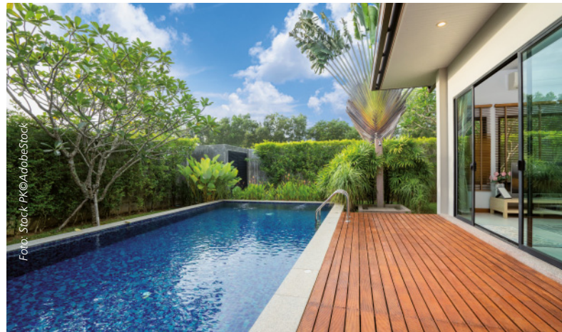
Boom während der Corona-Pandemie: Viele Eigentümer haben den Bau eines Schwimmbads umgesetzt.

Als Faustregel gilt: Grundsätzlich kann mit einem Bauspardarlehen finanziert werden, was fest mit einer Immobilie verbunden ist. Dazu zählen zum Beispiel ein Kachelofen oder eine Alarmanlage. Aber auch größere Anschaffungen wie ein Wintergarten, eine Garage oder ein Swimmingpool können mit einem Bauspardarlehen finanziert werden. Und selbst die Garten-Erstanlage ist zum Beispiel in der Regelung inbegriffen.