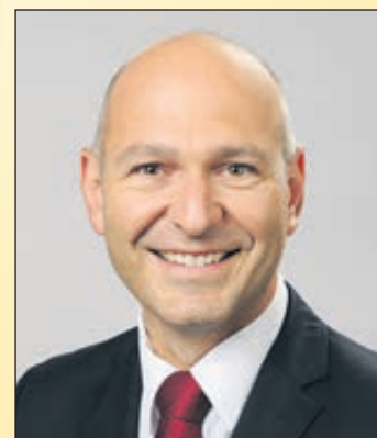
Christian Rönicke

Profitieren Sie als Baufinanzierer oder Anschlussfinanzierer jetzt von den aktuell sehr niedrigen Zinsen für Immobilienfinanzierungen bzw. Anschluss-